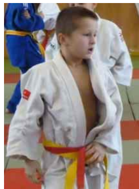
Stodvacet chlapců a děvčat se připravovalo na mistrovské soutěže ve sportovní hale ZŠ na Morávce.