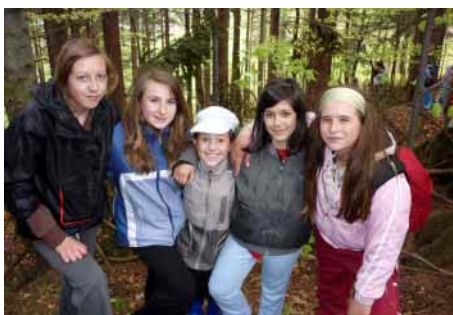
Série snímků z pobytu dětí na Morávce