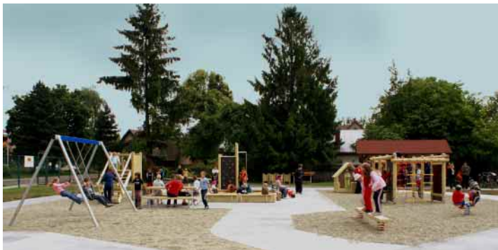
K dětskému dni bylo zprovozněno dětské hřiště.