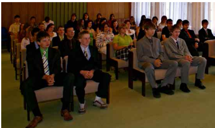
Skončil další školní rok. Se školou se loučili absolventi...