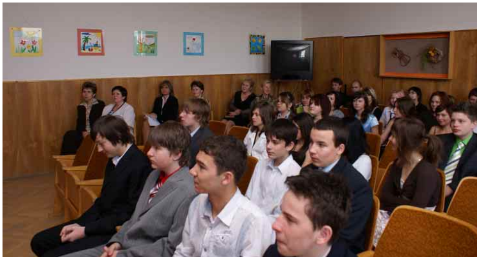
Ve škole proběhly již potřinácté malé maturity (k článku na straně 7).