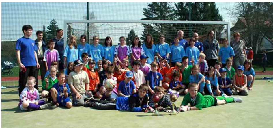
Účastníci II. ročníku Velikonočního turnaje žáků v kopané (k článku na straně 11). — Starší přípravka TJ Sokol Dobrá je 3. v okrese Frýdek-Místek. Z celkem 23 přihlášených týmů obsadila 3. místo, které vybojovala s týmem FK Frýdek-Místek.