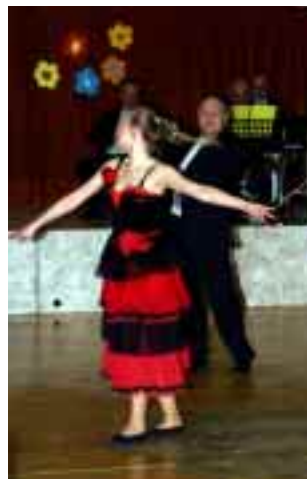
Několik snímků z oslav Mezinárodního dne žen 13. března 2009 v tělocvičné škole. Vystoupily děti mateřské školy, základní školy a sólisté operety Národního divadla moravskoslezského z Ostravy s pásmem operetních melodii.