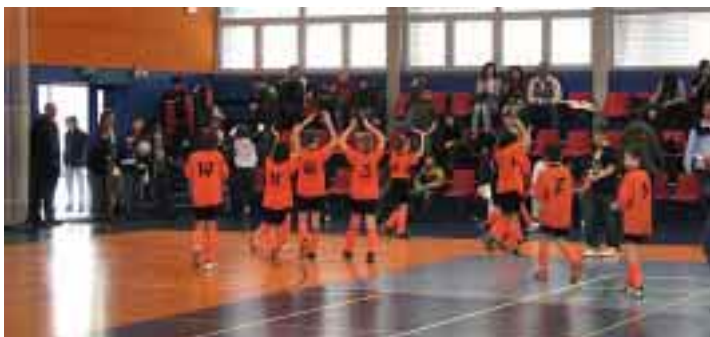
Starší přípravek TJ Sokol Dobrá je 3. v okrese Frýdek–Místek. Z celkem 23 přihlášených týmů obsadila 3. místo, když bojovala v závěru o celkové prvenství s týmem FK Frýdek–Místek. Na snímku poděkování divákům.