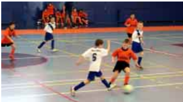
Obranná činnost proti FK Frýdek–Místek

tíku. Vytváříme si gólovou šanci, ale tyče má gólman Brušperku postaveny velmi dobře. V 10 minutě zápasu přichází zlom v tak výborném a vyrovnaném utkání a po nešťastném odkopu si dáváme vlastní gól. Toto zacloumá i profesionálním fotbalistou, ale co se dá dělat, musíme více otevřít hru a snažit se vyrovnat. To se nám však nedaří, čas ubíhá rychle a soupeř přidává druhý gól, kluci dál bojují i za tak nepříznivého stavu jako lvi, ale štěstíčko se staví k nám zády a my inkasujeme třetí gól a tím konec našeho snažení. Toto utkání prohráváme 0:3.