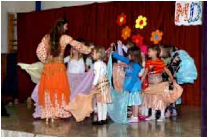
Z vystoupení dětí k Mezinárodnímu dni žen v tělocvičné škole.