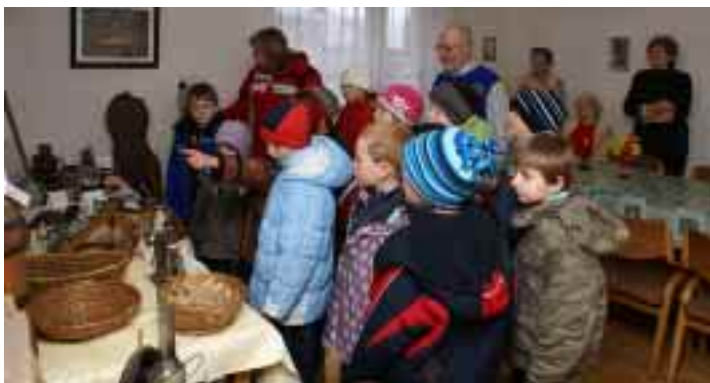
Výstava Klubu seniorů přilákala hlavně naši školní mládež.