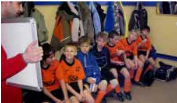
Mezi zápasy trenéři vysvětlovali herní taktiku

Ve čtvrtém utkání nás čeká TJ Pustkovec a naši borci prožívají nejhorší chvíle finálového turnaje. Táhnou však za jeden provaz a jejich nasazení je náramné a do hry dávají velký kus svého srdce což je senzační a je vidět, že zcela zapomněli na předešlé utkání. Daří se jim docela vše a tak nacházejí zpět svou herní pohodu a vytvářejí si gólové příležitosti, které využívají a dvakrát skórují a ujmají se vedení 2:0. Soupeř se ne-