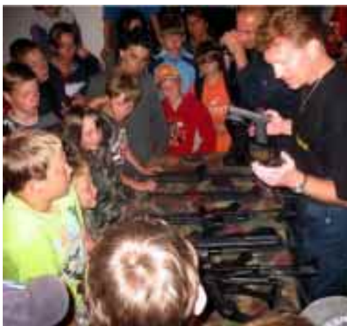
Snímky z maškarního reje a návštěvy zásahové jednotky.