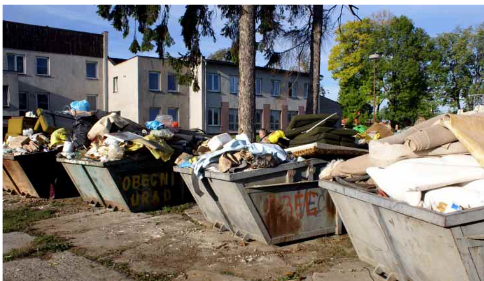
Co dokáží naši spoluobčané za víkend.