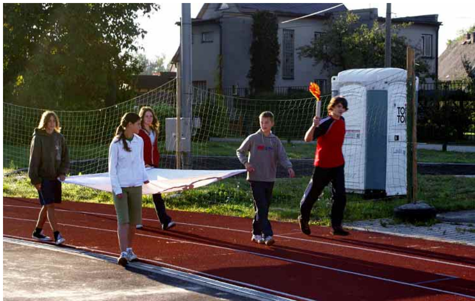
Olympiáda na Základní škole Dobrá