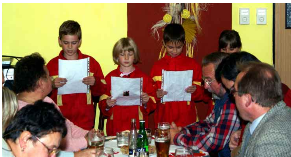
Z vystoupení mladých hasičů na slavnostní valné hromadě k 115. výročí založení Sboru dobrovolných hasičů v Dobré.