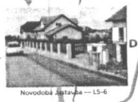
Novodobá zastávka — L5-6