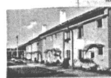
Bydlení v bytě „emilky“ (2000) — K8-7