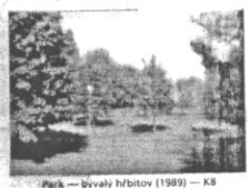
Park — bývalý hřbitov (1989) — K8