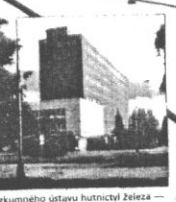
Výzkumného ústavu hutnictví železa — VUHŽ (1970) — K3