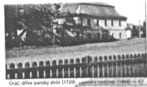
Ořáč, dříve panský dvůr (1720). Lavendulí hraděním (1860) — K7