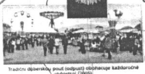
Tradiční občerský pout (podpůr) občanské katecholské občerstvení (2009)