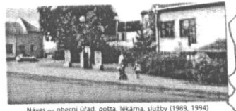
Náves — obecní úřad, pošta, lékárna, služby (1989, 1994). Pomníky padlým ve světových válkách (odhaleny 1938, 1945), bytka prezidenta Masaryka (1938) — K8