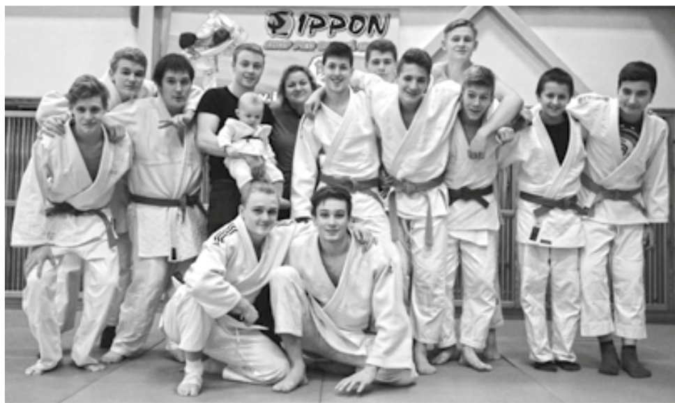
Kolektiv dorostenců vybojoval stříbro v prestižní dorostenecké lize.

Přejeme všem sportovcům a občanům Dobré krásné vánoce a úspěšný rok 2017.