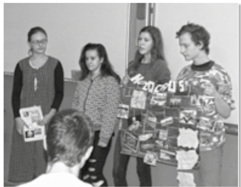
Devátáci vyrobili na téma holocaustu pozoruhodné informační plakáty.

Každým rokem si s žáky devátého ročníku v rámci výuky historie 2. světové války připomínáme hrůzy nacistického holocaustu. Také letos si žáci připravovali v hodinách dějepisu informační plakát, aby se lépe seznámili s touto děsivou tragédií dějin. Devátáci se seznámili se základními pojmy, které souvisejí s tematikou holocaustu a také zpracovávali životní příběh konkrétní oběti holocaustu z řad českých občanů židovského původu. Svoji práci pak prezentovali v jednom ze tří projektových dnů, které jsme tématu na naší škole věnovali.