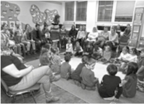
Rodiče mohli být na své prvňáčky právem hrdí.