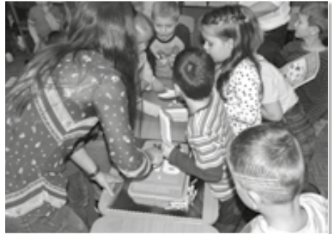
Slabikář je sice super, ale nic se nevyrovná sladkému dortu.