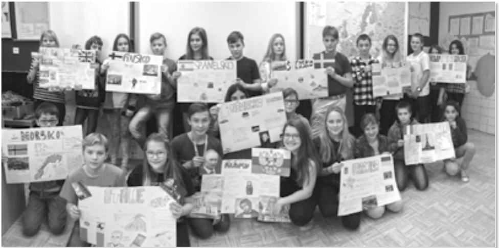
Seďmáci vyrobili svým státům krásné plakáty a zdařile prezentovali zjištěné informace.

V předposledním listopadovém týdnu výuku sedmých tříd zpřijemnil oblíbený projekt Evropa zaměřený na poznávání evropských zemí z hlediska zeměpisu, kul- tury, historie či významných osobností.