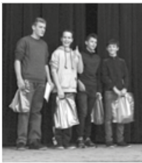
Úspěšné družstvo devátáků se raduje z úspěchu na soutěži Náboj junior.

V pátek 25. 11. se konala ve Frýdlantě nad Ostravicí mezinárodní matematicko-