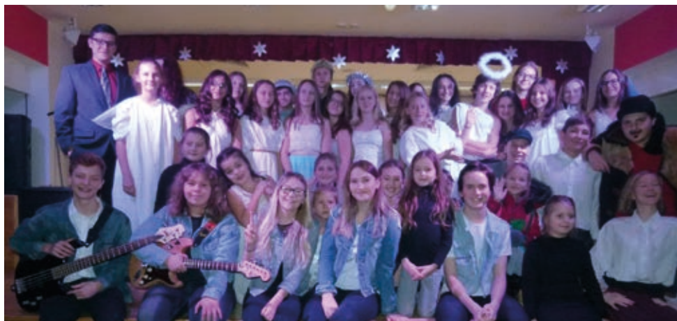
Naše veselá divadelně-hudební společnost měla z diváckého úspěchu velkou radost.