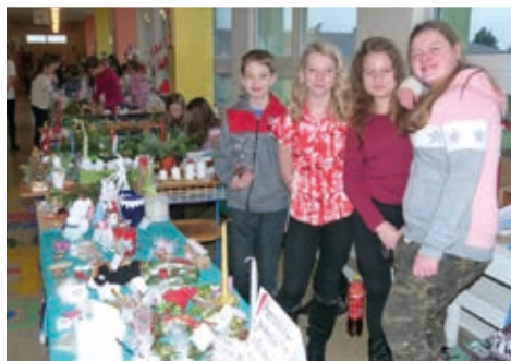
Stánky jednotlivých tříd překypovaly rozkošnými vánočními drobnostmi.

delní představení na motivy známé televizní pohádky Anděl Páně. Bravurní herecké výkony doprovázela hudební a pěvecká čísla a diváci zasluženě ocenili vystupující bouřlivým potleskem.