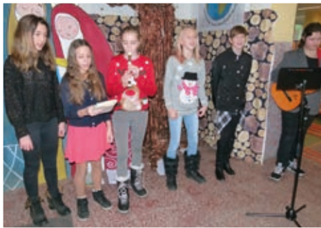
Žáci 6. C vítali všechny milé hosty zpěvem koled.

Kdo toužil po zábavě ze soudku umění, zamířil do školního sálu, kde proběhla dvě představení pro veřejnost. Letos naši měli herci, zpěváci a muzikanti nastudovali diva-